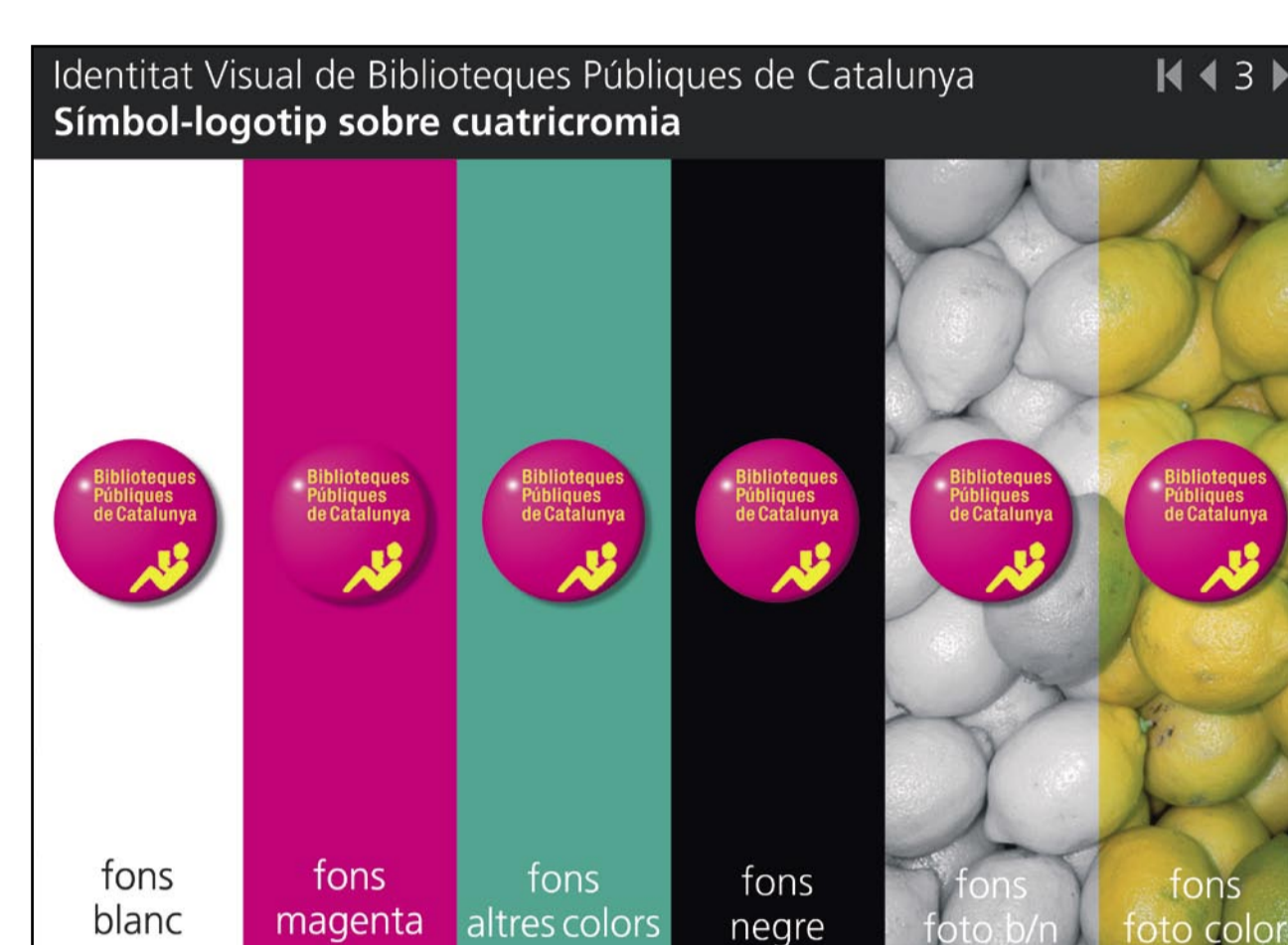
Identidad visual para las bibliotecas públicas de Catalunya realizada por América Sánchez